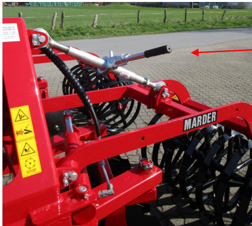
Hebel zur Tiefeneinstellung der Scheiben

Die Tiefeneinstellung der Scheiben erfolgt manuell über die jeweiligen Hebel rechts und links. Durch die Hebel heben und senken sich die Walzensegmente und entsprechend erfolgt so die Tiefeneinstellung der Scheiben.